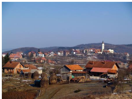
- Cetinograd - panorama -

(Cetinograd – Bilo – Cetin – Cetinograd – Klokoč – Maljevac - Cetinograd)