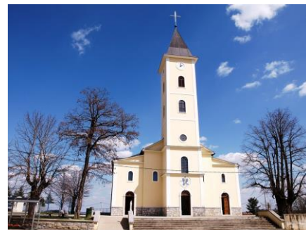
- crkva Uznesenja BDM -