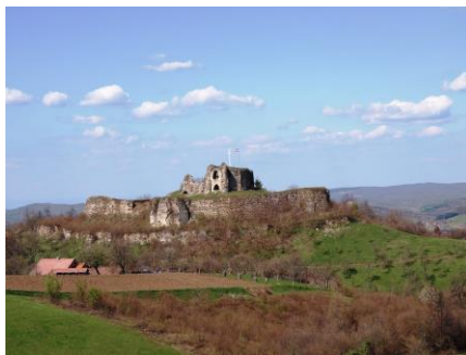
- stari grad Cetin -